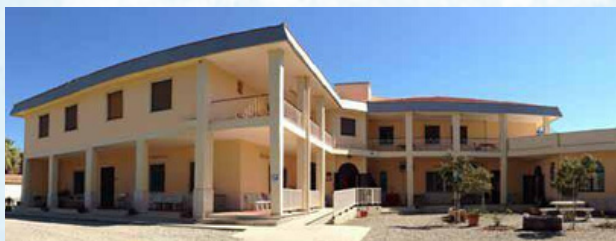
Casa di spiritualità e accoglienza Villa Tecla (Istituto Suore Orsoline di Somasca) Via Rimini, 29 - 09045 Quartu Sant'Elena (CA)